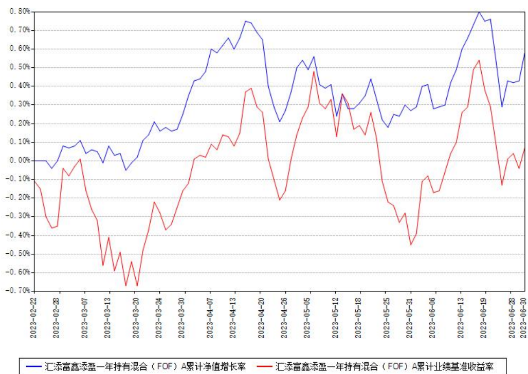
汇添富鑫添盈一年持有混合（FOF）A累计净值增长率与同期业绩基准收益率对比图

（二）自基金合同生效以来基金累计净值增长率变动及其与同期业绩比较基准收益率变动的比较图