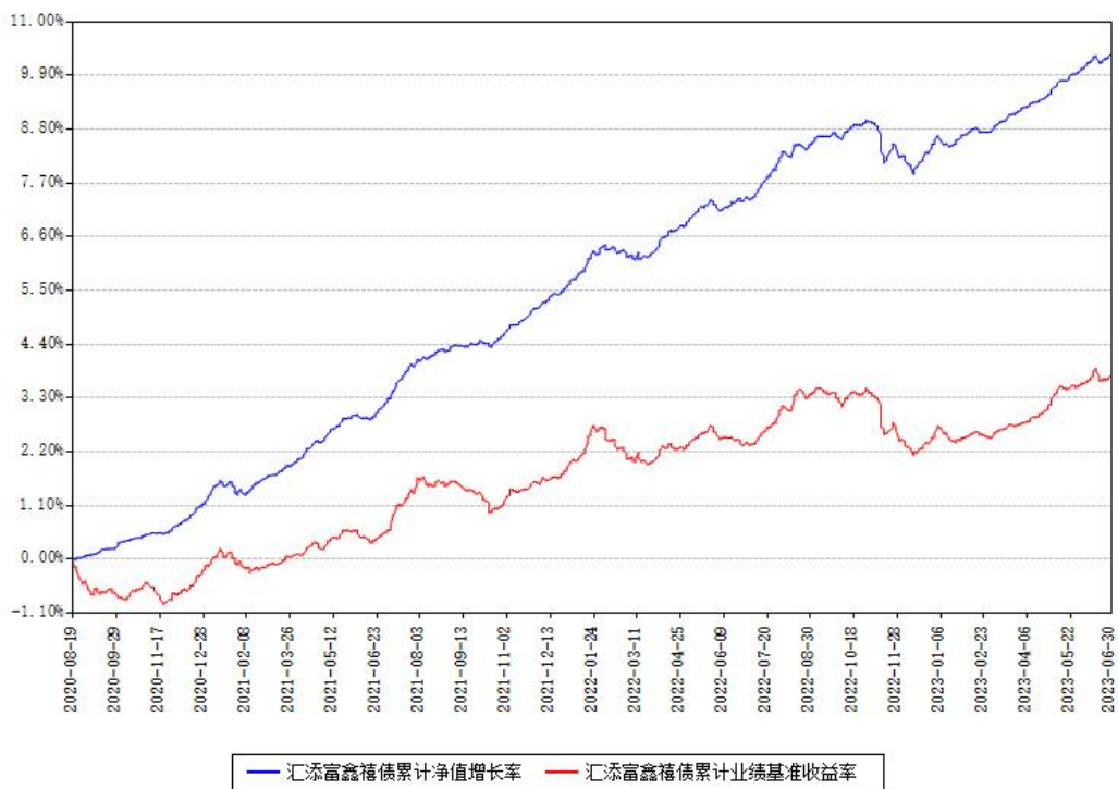
汇添富鑫禧债累计净值增长率与同期业绩基准收益率对比图