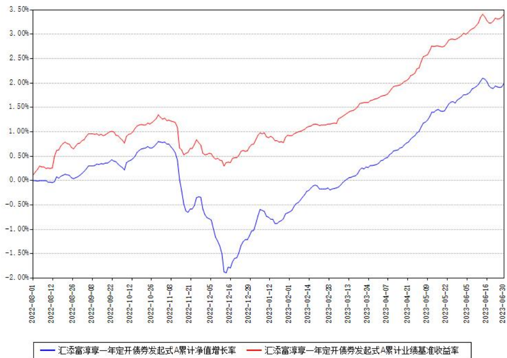
汇添富淳享一年定开债券发起式A累计净值增长率与同期业绩基准收益率对比图