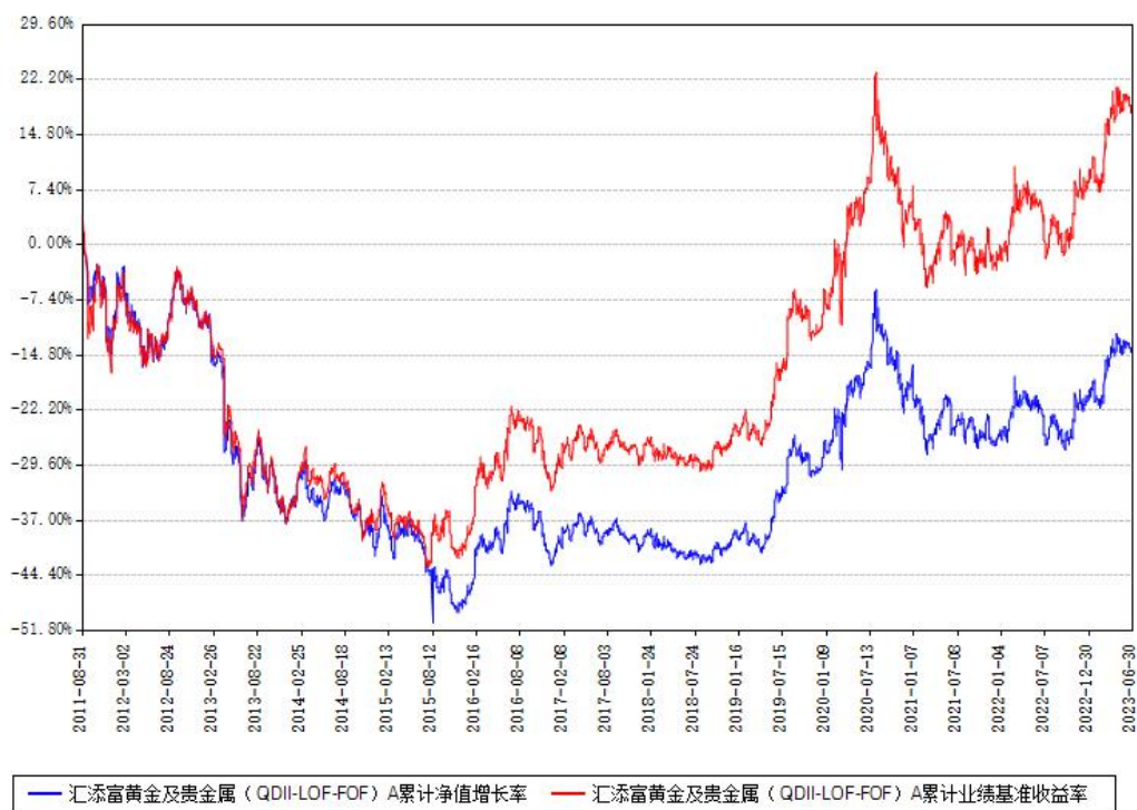
汇添富黄金及贵金属（QDII-LOF-FOF）A 累计净值增长率与同期业绩基准收益率对比图

2、自基金合同生效以来基金累计净值增长率变动及其与同期业绩比较基准收益率变动的比较图