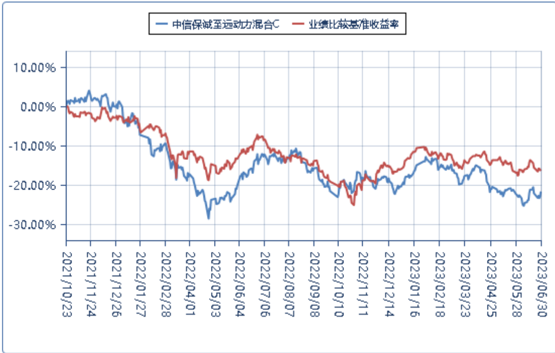
中信保诚至远动力混合 E