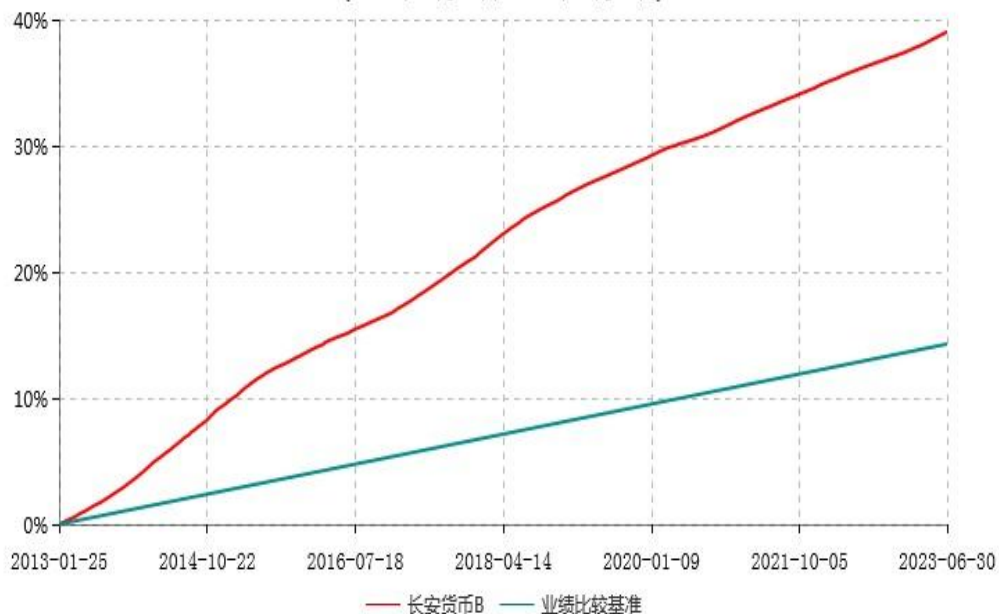
长安货币B累计净值收益率与业绩比较基准收益率历史走势对比图 (2013年01月25日-2023年06月30日)

本基金的收益分配是按月结转份额。按基金合同规定，本基金自基金合同生效起 6 个月为建仓期，截止到建仓期结束时，本基金的各项投资组合比例已符合基金合同的相关规定。图示日期为 2013 年 1 月 25 日至 2023 年 6 月 30 日。