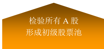
图：本基金选股流程