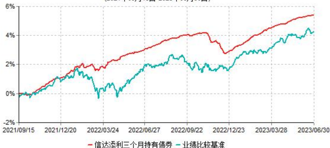
信达添利三个月持有期债券型集合资产管理计划累计净值增长率与业绩比较基准收益率历史走势对比图 (2021年09月15日-2023年06月30日)