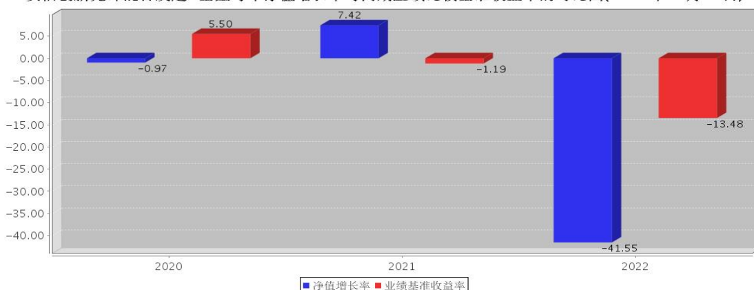
安信创新先锋混合发起C基金每年净值增长率与同期业绩比较基准收益率的对比图(2022年12月31日)

注:基金合同生效当年期间的相关数据按实际存续期计算。基金的过往业绩并不代表其未来表现。