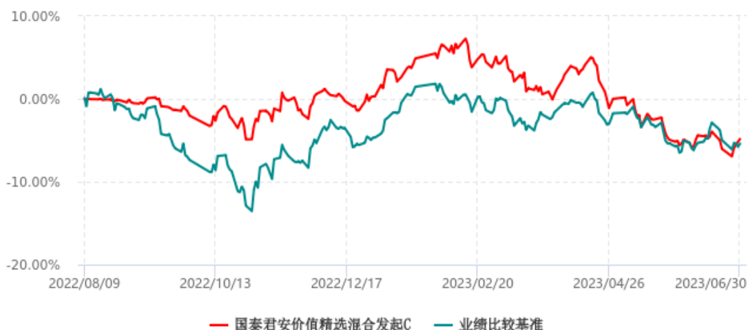
国泰君安价值精选混合发起C累计净值增长率与业绩比较基准收益率历史走势对比图 (2022年08月09日-2023年06月30日)