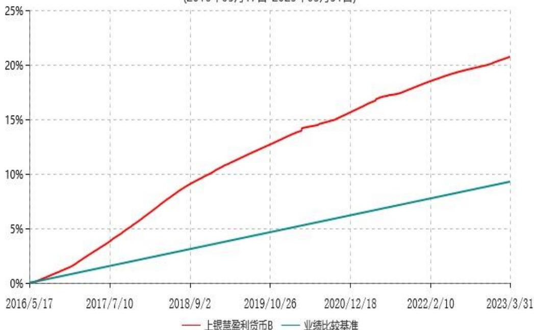
上银慧盈利货币B累计净值收益率与业绩比较基准收益率历史走势对比图 (2016年05月17日-2023年03月31日)