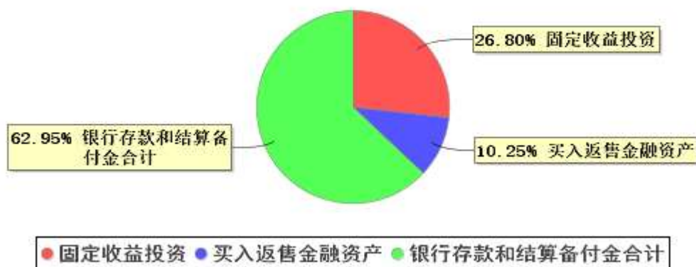
投资组合资产配置图表(2023年6月30日)