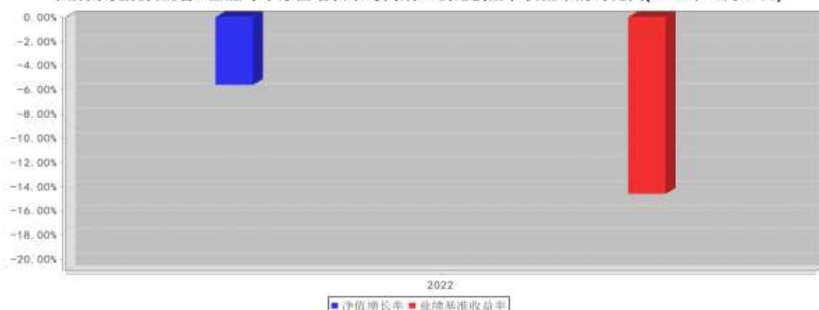
大成聚优成长混合C基金每年净值增长率与同期业绩比较基准收益率的对比图(2022年12月31日)