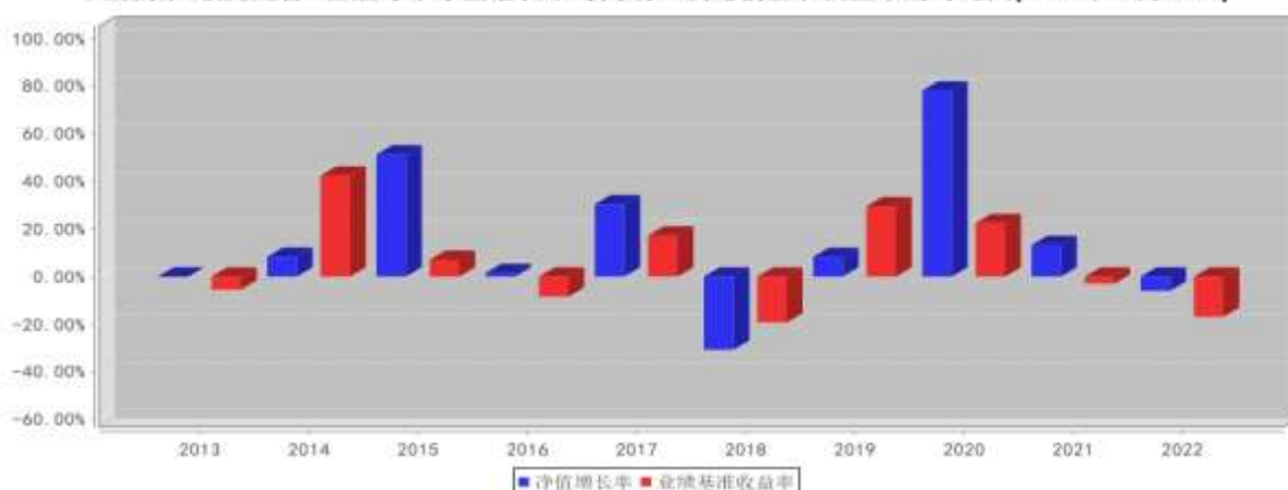
大成景阳领先混合A基金每年净值增长率与同期业绩比较基准收益率的对比图(2022年12月31日)

注:1、基金的过往业绩不代表未来表现。 2、如合同生效当年不满完整自然年度的，按实际期限计算净值增长率。