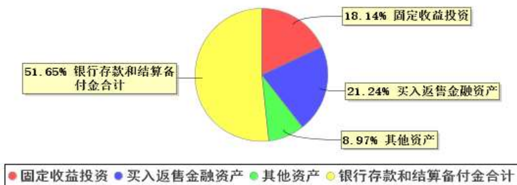
投资组合资产配置图表(2023年6月30日)