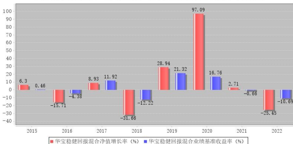
华宝稳健回报混合每年净值增长率与同期业绩比较基准收益率的对比图