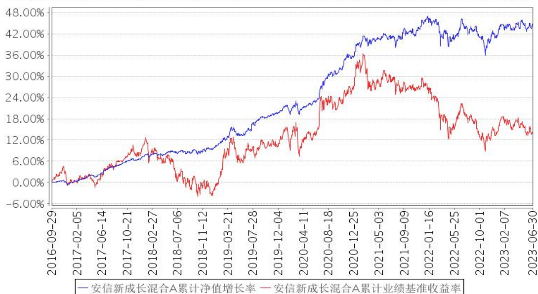
安信新成长混合A累计净值增长率与同期业绩比较基准收益率的历史走势对比图