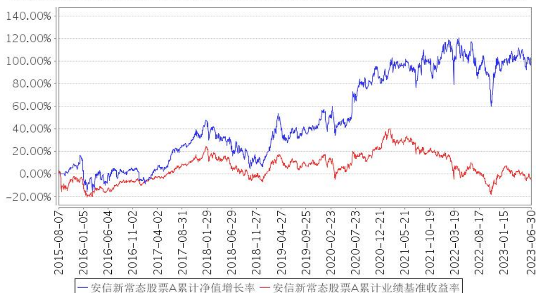
安信新常态股票A累计净值增长率与同期业绩比较基准收益率的历史走势对比图