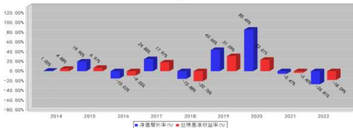
民生加银优选股票基金每年净值增长率与同期业绩比较基准收益率的对比图 (2022年12月31日)

注：1. 基金合同生效当年的相关数据按实际存续期计算，不按整个自然年度进行折算。 2. 基金过往业绩不代表未来表现。