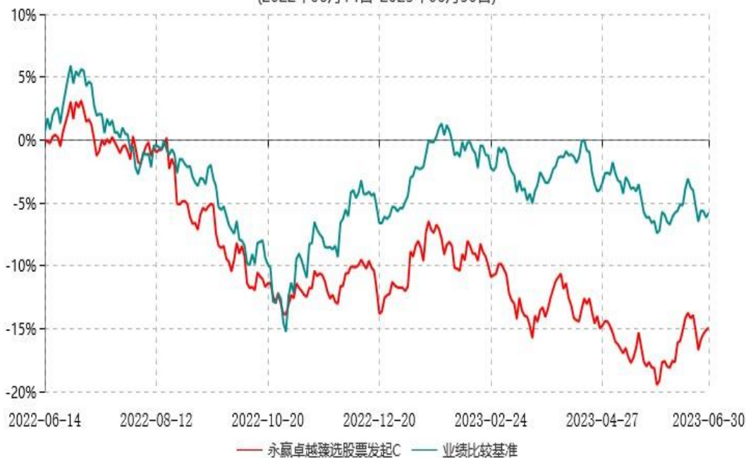
永赢卓越臻选股票发起C累计净值增长率与业绩比较基准收益率历史走势对比图 (2022年06月14日-2023年06月30日)