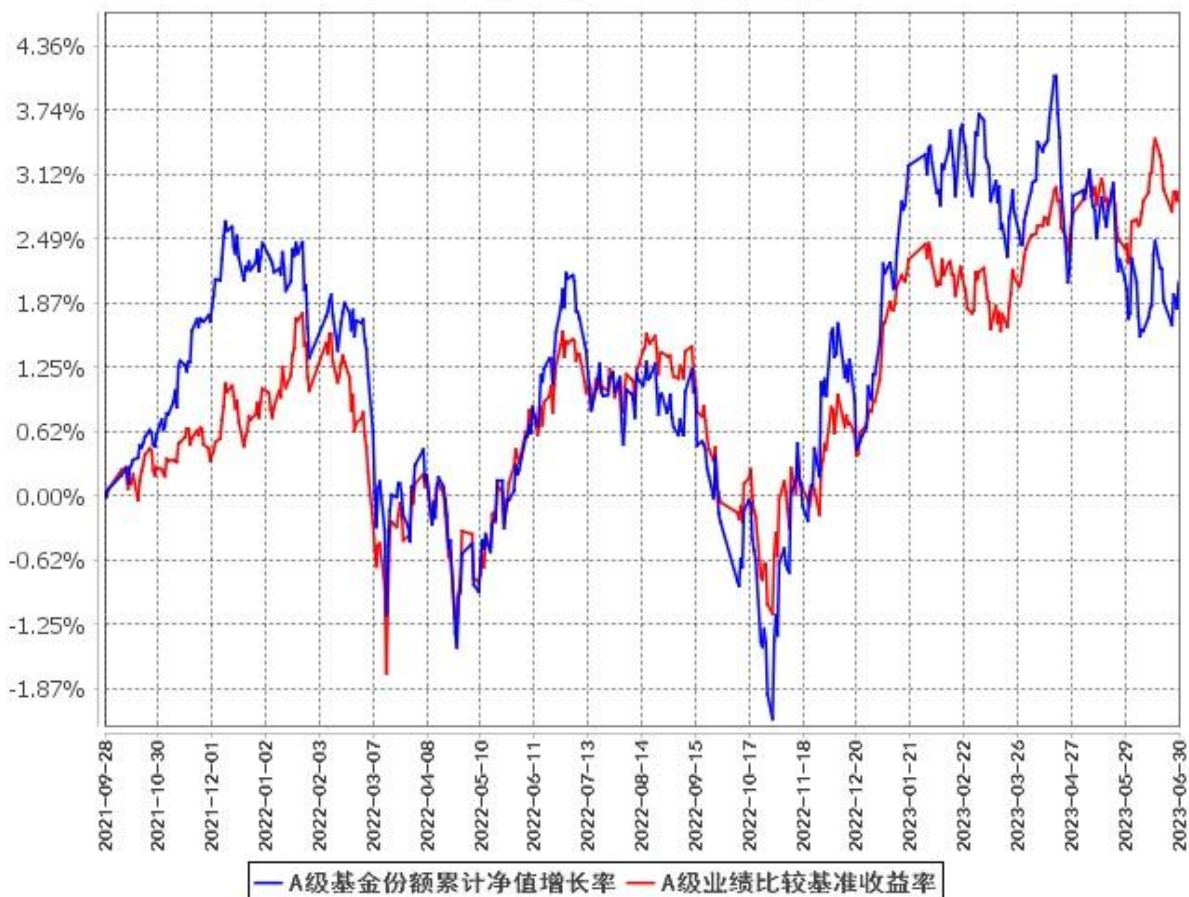
A级基金份额累计净值增长率与同期业绩比较基准收益率的历史走势对比图 (2021年9月28日至2023年6月30日)