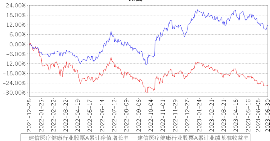
建信医疗健康行业股票A累计净值增长率与同期业绩比较基准收益率的历史走势对比图