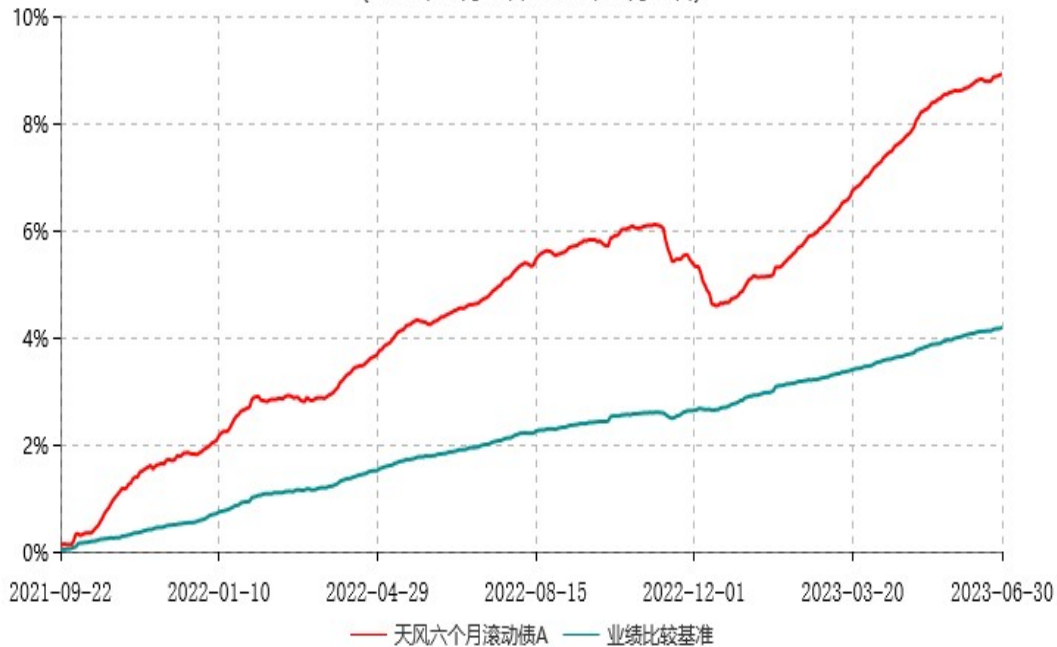
天风六个月滚动债A累计净值增长率与业绩比较基准收益率历史走势对比图 (2021年09月22日-2023年06月30日)