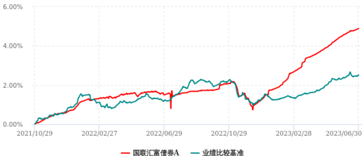
国联汇富债券C累计净值增长率与业绩比较基准收益率历史走势对比图