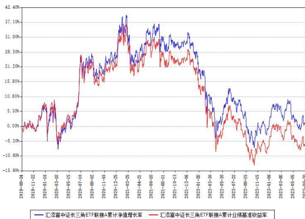
汇添富中证长三角ETF联接A累计净值增长率与同期业绩比较基准收益率对比图