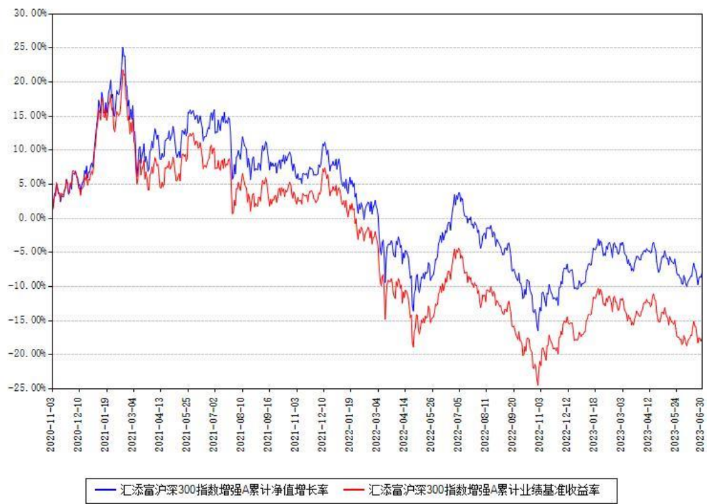
汇添富沪深300指数增强A累计净值增长率与同期业绩基准收益率对比图