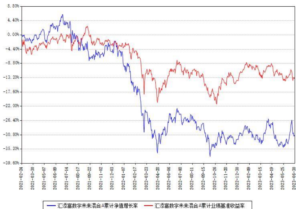
汇添富数字未来混合A累计净值增长率与同期业绩基准收益率对比图