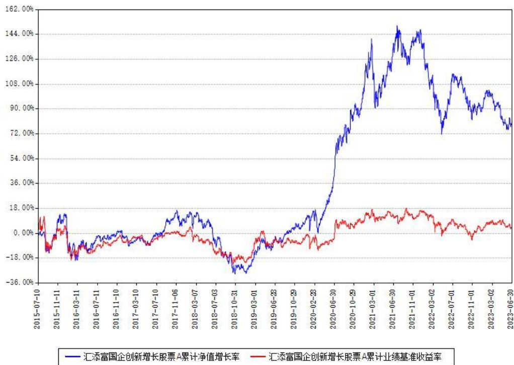
汇添富国企创新增长股票A累计净值增长率与同期业绩基准收益率对比图