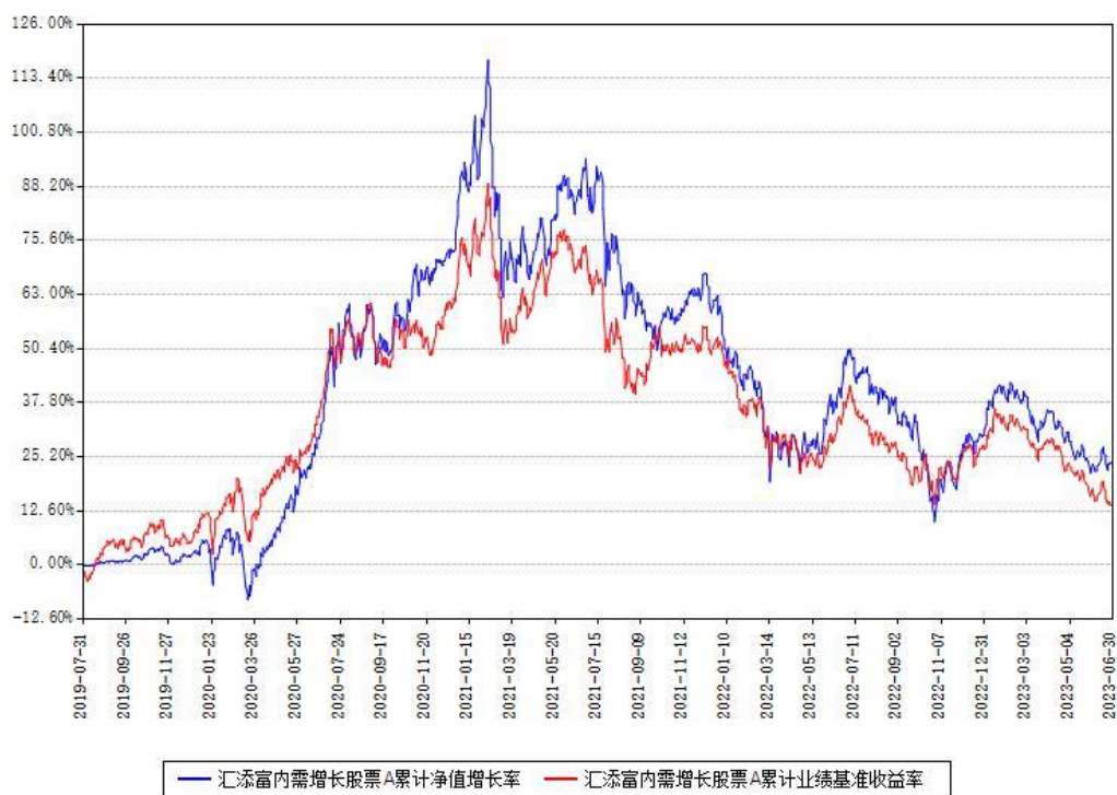
汇添富内需增长股票A累计净值增长率与同期业绩比较基准收益率对比图