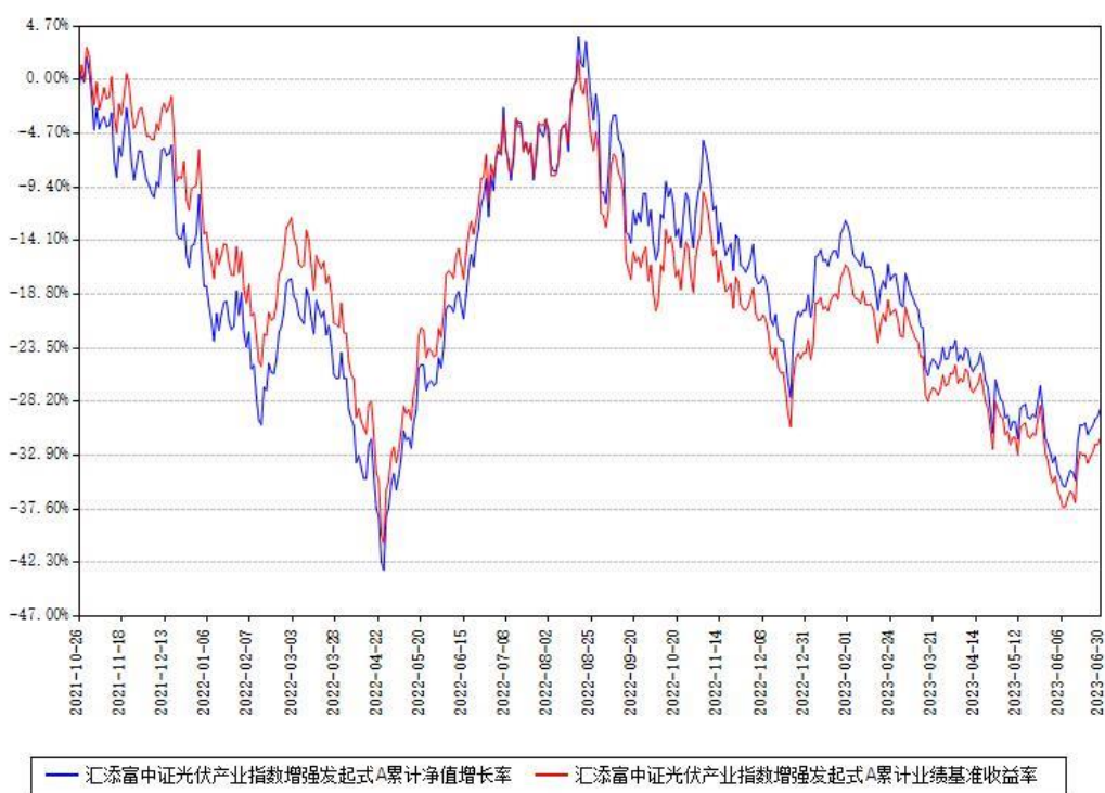
汇添富中证光伏产业指数增强发起式A累计净值增长率与同期业绩基准收益率对比图