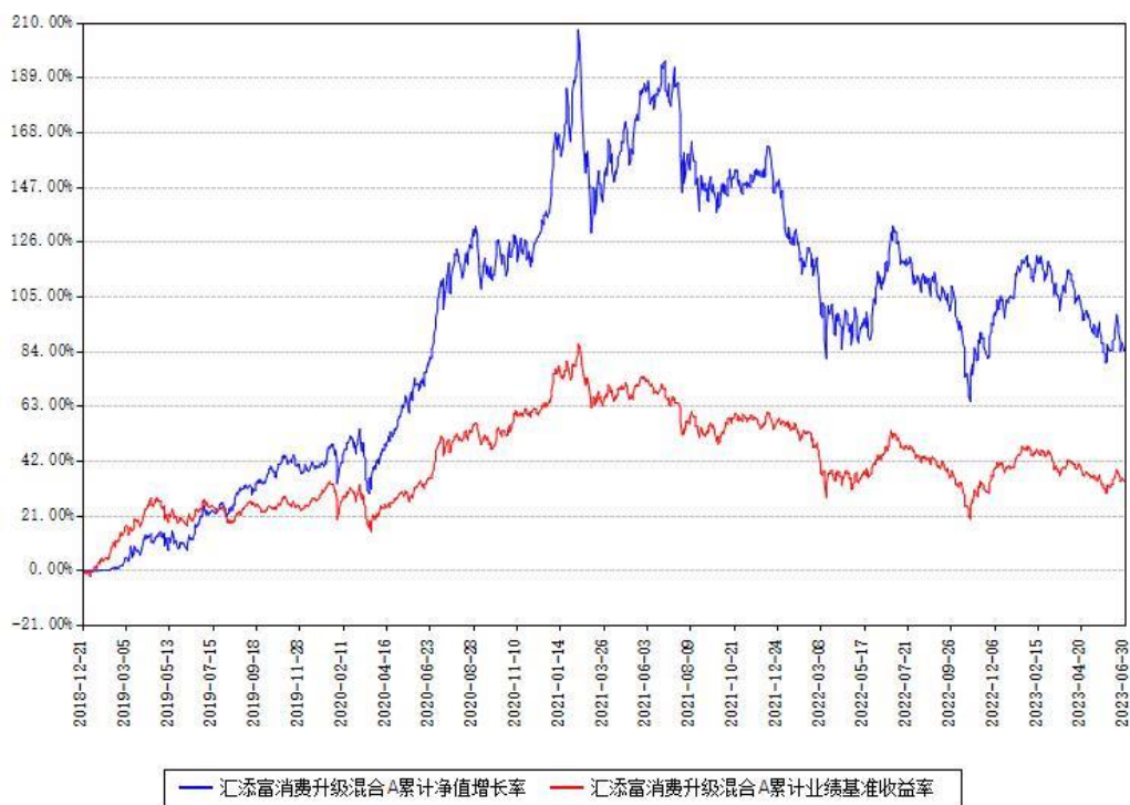
汇添富消费升级混合A累计净值增长率与同期业绩基准收益率对比图