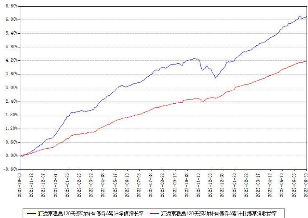
汇添富稳鑫120天滚动持有债券A累计净值增长率与同期业绩基准收益率对比图