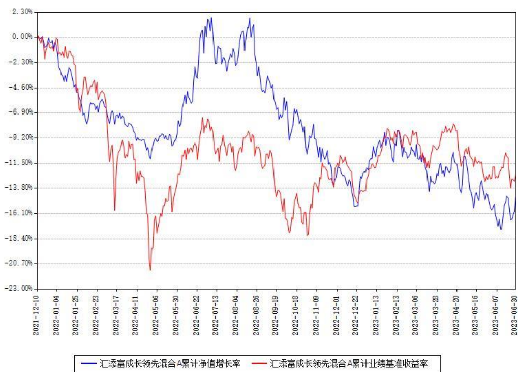
汇添富成长领先混合A累计净值增长率与同期业绩基准收益率对比图