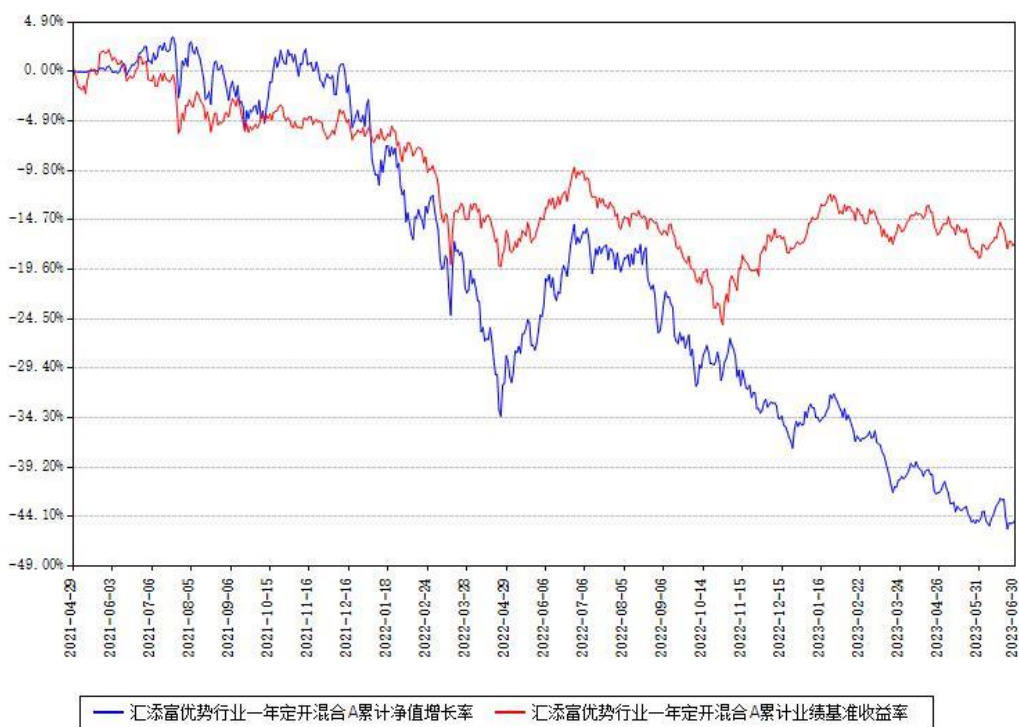
汇添富优势行业一年定开混合A累计净值增长率与同期业绩基准收益率对比图