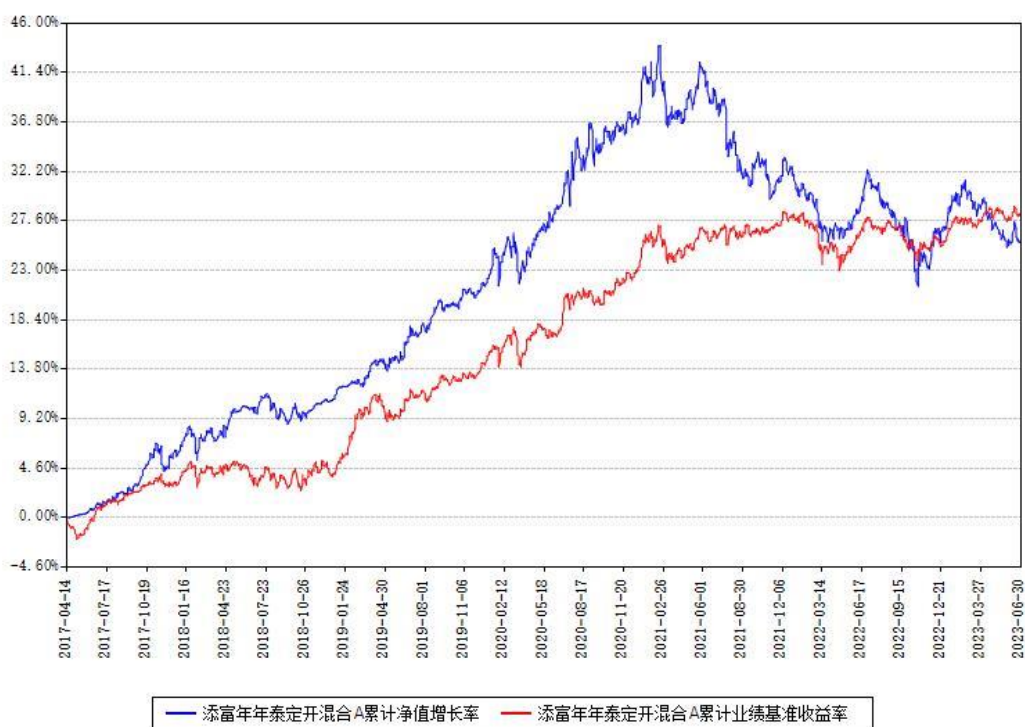
添富年年泰定开混合A累计净值增长率与同期业绩比较基准收益率对比图