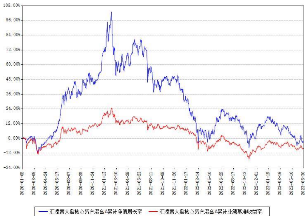
汇添富大盘核心资产混合A累计净值增长率与同期业绩基准收益率对比图