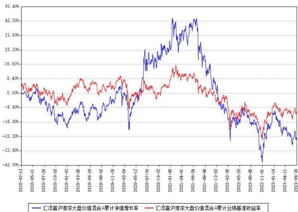
汇添富沪港深大盘价值混合A累计净值增长率与同期业绩比较基准收益率对比图