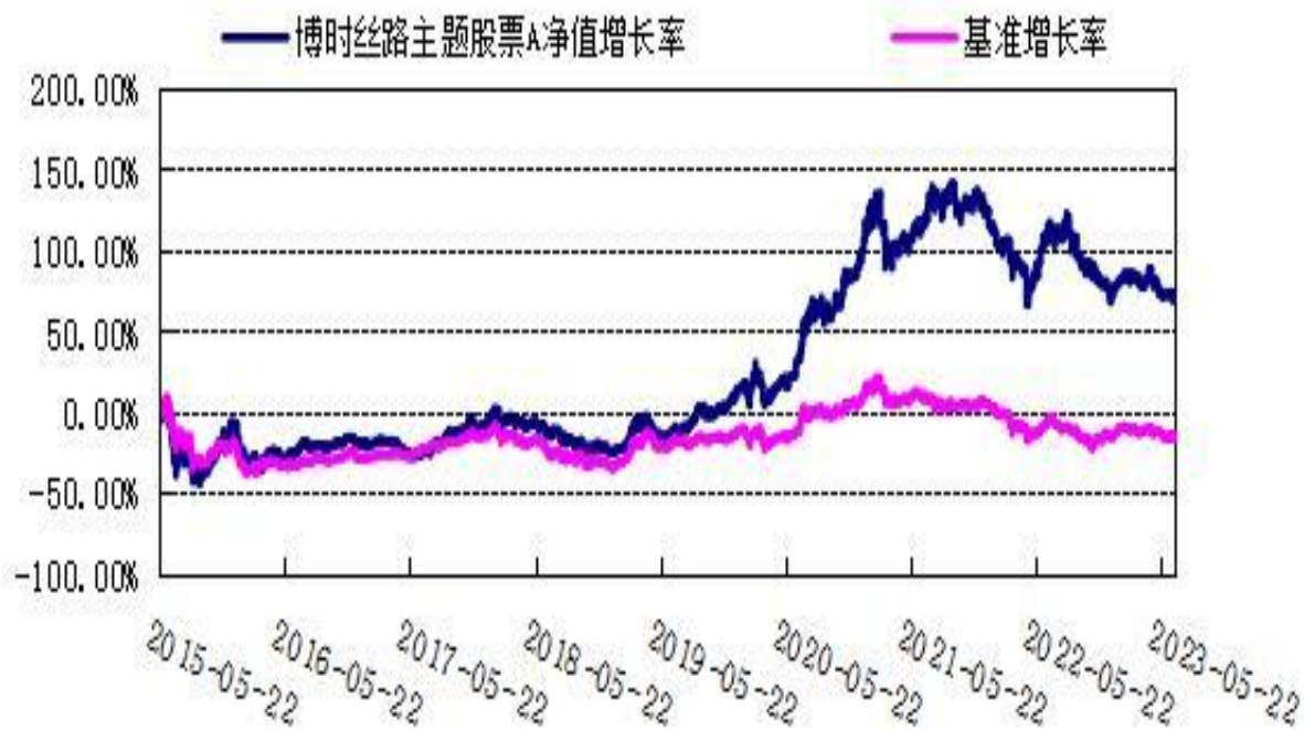
博时丝路主题股票 C