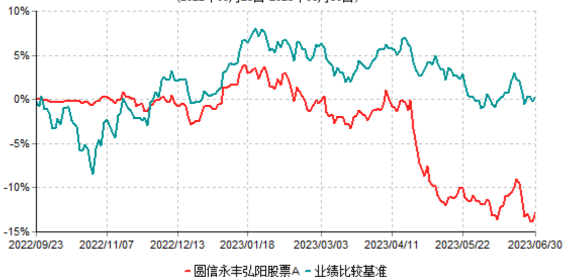
圆信永丰弘阳股票A累计净值增长率与业绩比较基准收益率历史走势对比图 (2022年09月23日-2023年06月30日)

注：自基金合同生效后，截止报告期末，本基金成立不满一年；本基金已完成建仓但报告期末距建仓结束不满一年，建仓结束时各项资产配置比例符合合同约定。