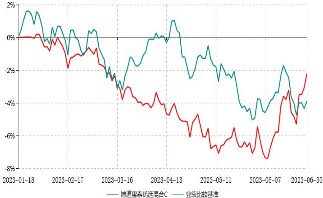
博道惠泰优选混合C累计净值增长率与业绩比较基准收益率历史走势对比图 (2023年01月18日-2023年06月30日)

注：本基金基金合同生效日为2023年1月18日，建仓期为自基金合同生效日起的6个月。基金合同生效日至报告期期末，本基金尚处于建仓期，且运作时间未满一年。