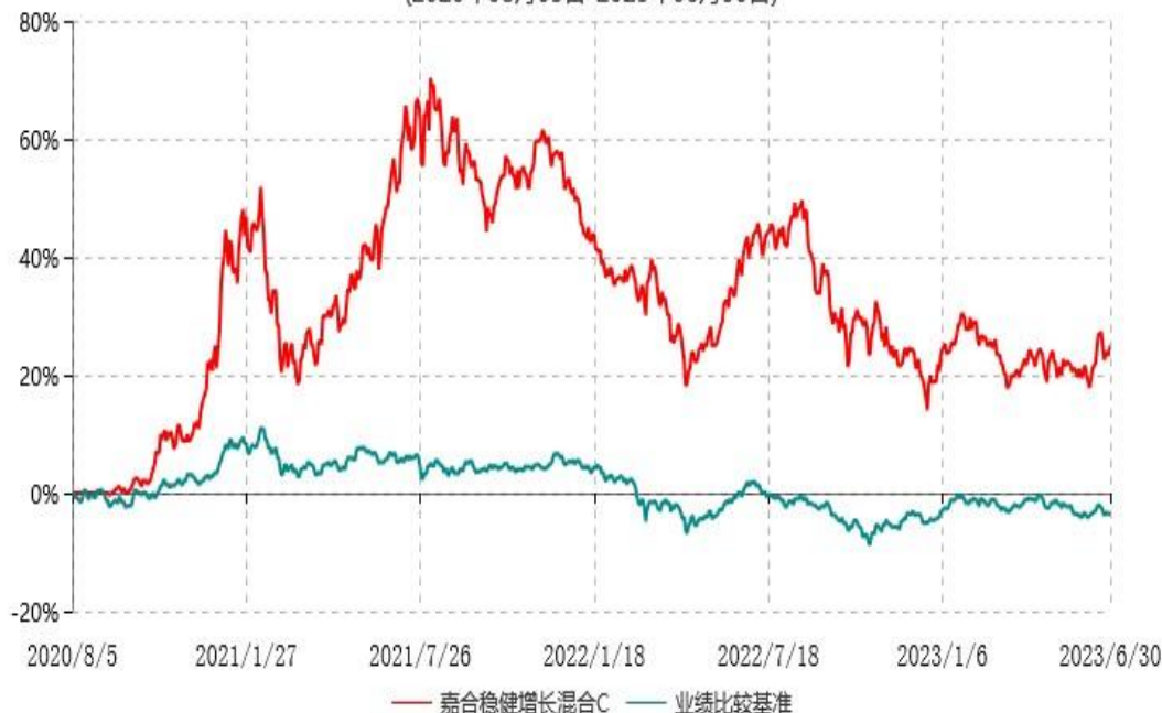
嘉合稳健增长混合C累计净值增长率与业绩比较基准收益率历史走势对比图 (2020年08月05日-2023年06月30日)