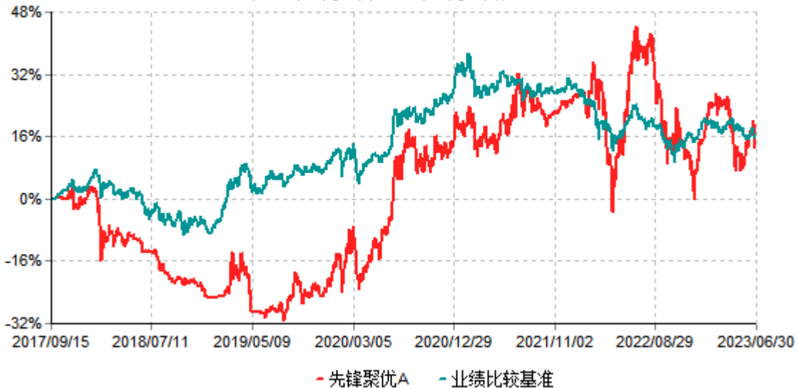
先锋聚优A累计净值增长率与业绩比较基准收益率历史走势对比图 (2017年09月15日-2023年06月30日)