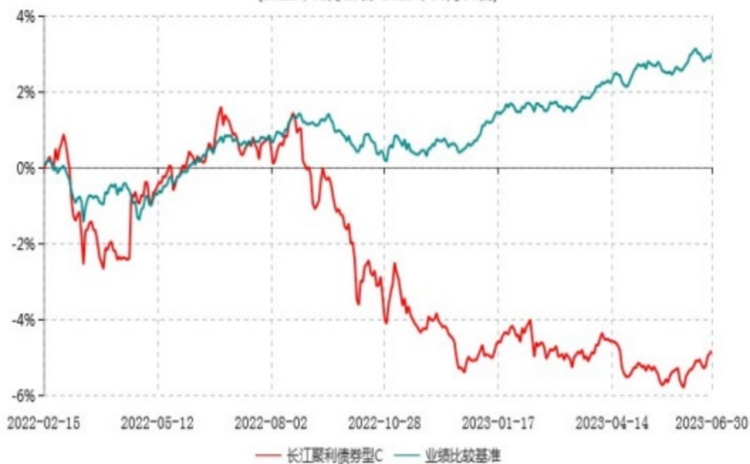
长江聚利债券型C累计净值增长率与业绩比较基准收益率历史走势对比图 (2022年02月15日-2023年06月30日)

注：本基金A类份额“自基金合同生效以来”的报告期为2022年1月11日至2023年6月30日，建仓期为基金合同生效日起6个月内，建仓期结束时各项资产配置比例均符合基金合同约定。