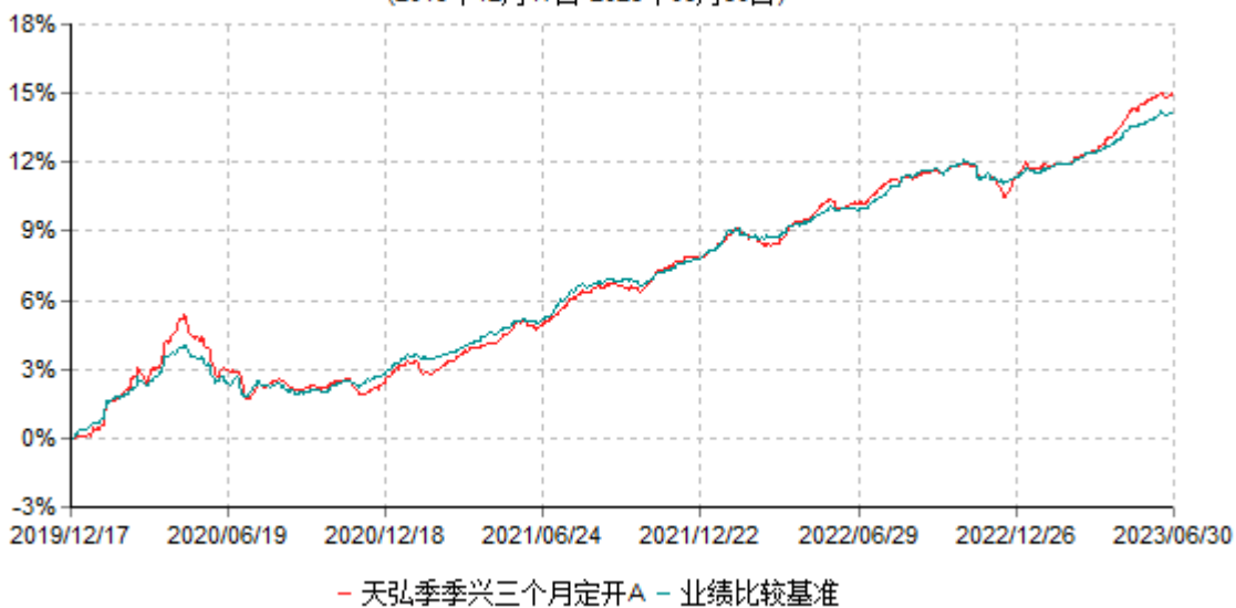
天弘季季兴三个月定开A累计净值增长率与业绩比较基准收益率历史走势对比图 (2019年12月17日-2023年06月30日)