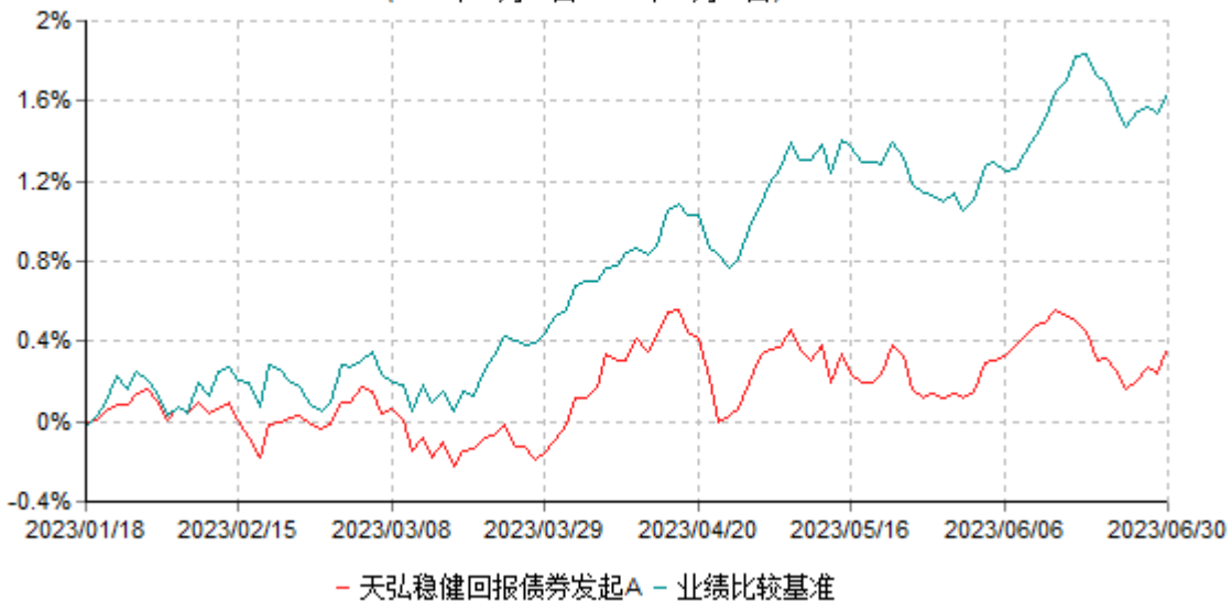
天弘稳健回报债券发起A累计净值增长率与业绩比较基准收益率历史走势对比图 (2023年01月18日-2023年06月30日)