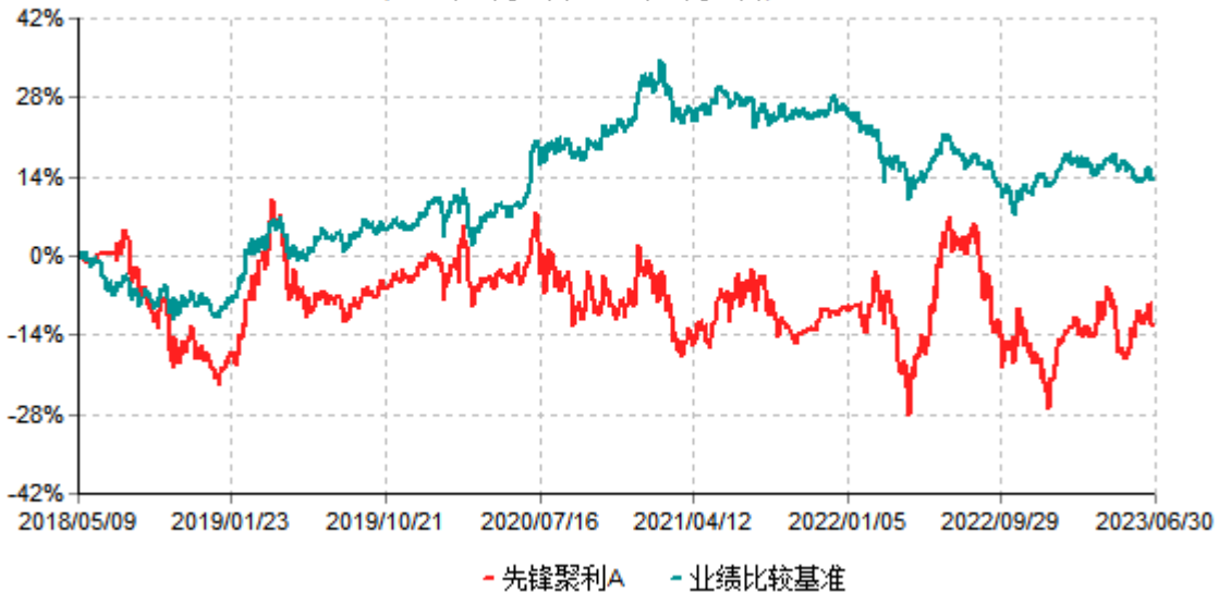
先锋聚利A累计净值增长率与业绩比较基准收益率历史走势对比图 (2018年05月09日-2023年06月30日)