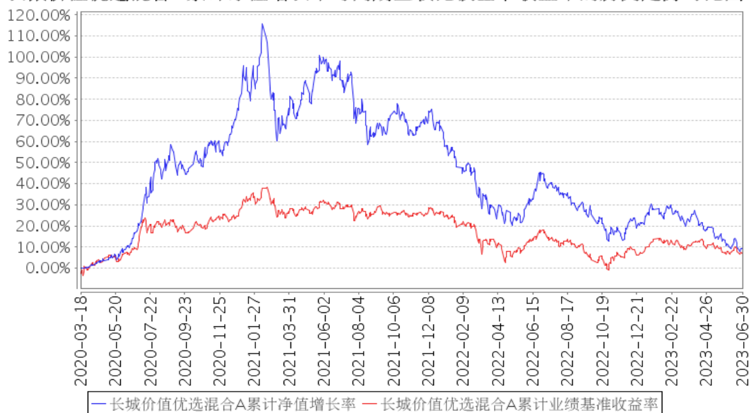
长城价值优选混合A累计净值增长率与同期业绩比较基准收益率的历史走势对比图