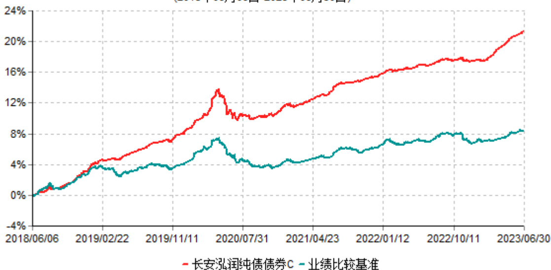
长安泓润纯债债券C累计净值增长率与业绩比较基准收益率历史走势对比图 (2018年06月06日-2023年06月30日)

根据基金合同的规定，自基金合同生效日起6个月内基金各项资产配置比例需符合基金合同要求。本基金在建仓期结束后，各项资产配置比例已符合基金合同有关投资比例的约定。基金合同生效日至报告期末，本基金运作时间已满一年。图示日期为2018年6月6日至2023年6月30日。