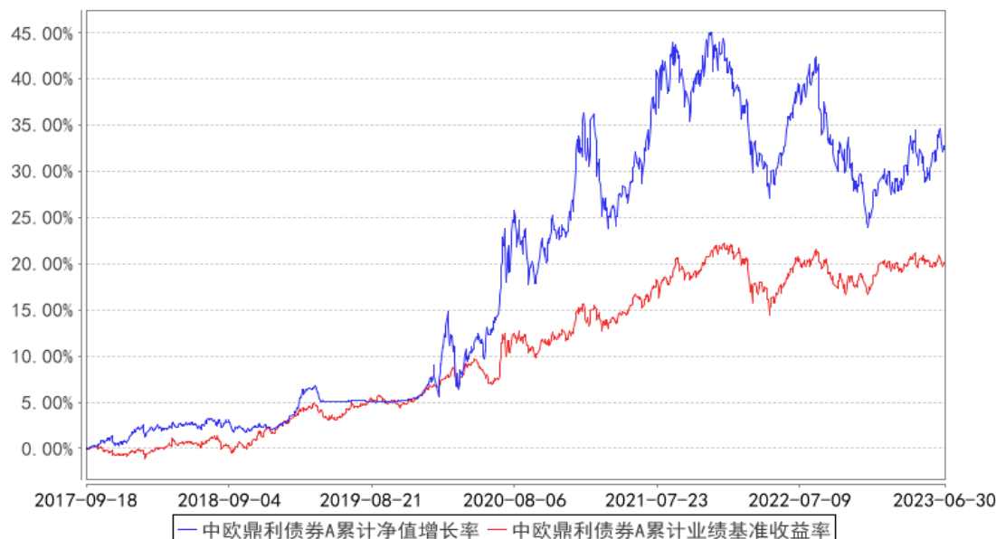
中欧鼎利债券A累计净值增长率与同期业绩比较基准收益率的历史走势对比图

注：本基金转型生效日为 2017 年 9 月 18 日，自 2020 年 6 月 3 日起，本基金业绩比较基准由“中国债券总值指数收益率*90%+沪深 300 指数收益率*10%”变更为“中证 800 指数收益率*15%+中证可转换债券指数*25%+中债综合财富指数收益率*60%”，图示日期为 2017 年 9 月 18 日至 2023 年 06 月 30 日。