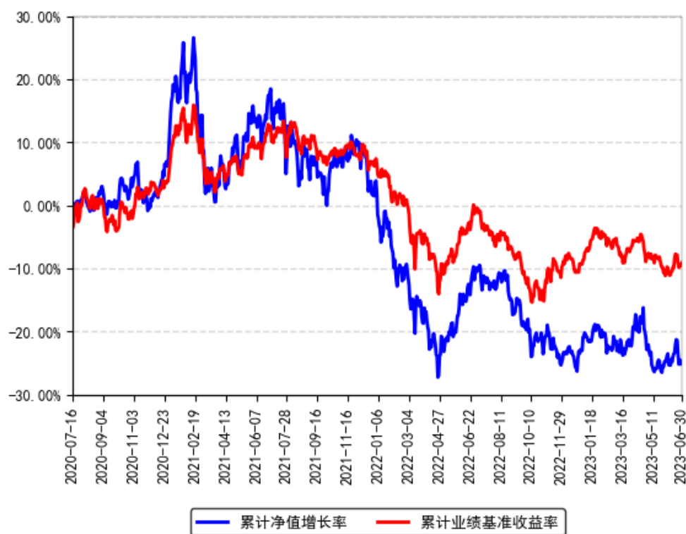
南方核心成长混合A累计净值增长率与同期业绩比较基准收益率的历史走势对比图